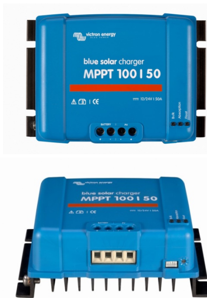
Solcellsladdningsregulator MPPT 100/50